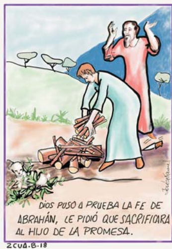
DIBUJO: Mons. Lorca Planes