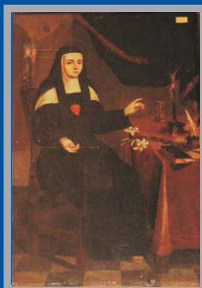
Santa Clara de Montefalco Anónimo, s. XVIII Monasterio del Corpus Christi Agustinas Descalzas, Murcia

En el Monasterio del Corpus Christi se conservan dos imágenes de Santa Clara de Montefalco: una en el retablo mayor y este lienzo en el coro bajo conventual. Los atributos permiten una clara identificación: su corazón en el que aparecieron, tras su muerte, impresas las armas de la pasión de Cristo, y las tres piedras del mismo tamaño que aparecieron en su vesícula, pesando cada una de ellas lo mismo que las tres juntas. La singularidad del lienzo está en aparecer la santa vestida con el hábito de agustina descalza y no con el de agustina, orden a la que pertenecía. Su beatificación en la primera mitad del siglo XVIII llevaría al convento murciano de Agustinas Descalzas a desear incluir una imagen suya entre sus obras y a hacerla más propia vistiéndola como ellas vestían, siendo incluso posible que se trate de un "retrato a lo sagrado", retrato de alguna religiosa que viviera en la comunidad representada al modo de Santa Clara de Montefalco, costumbre habitual durante los siglos del Barroco.