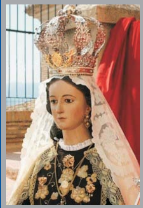
Virgen del Carmen, 1947 José Sánchez Lozano Ermita del Carmen, Mula

En 1606 se fundó en Mula la Hermandad del Carmen. La primitiva escultura de la titular fue destruida durante la Guerra Civil, y tras unos años en los que recibe culto una imagen traída de Valencia, finalmente, en 1947 se encarga al escultor José Sánchez Lozano la ejecución de una nueva talla más acomodada al gusto de los devotos.