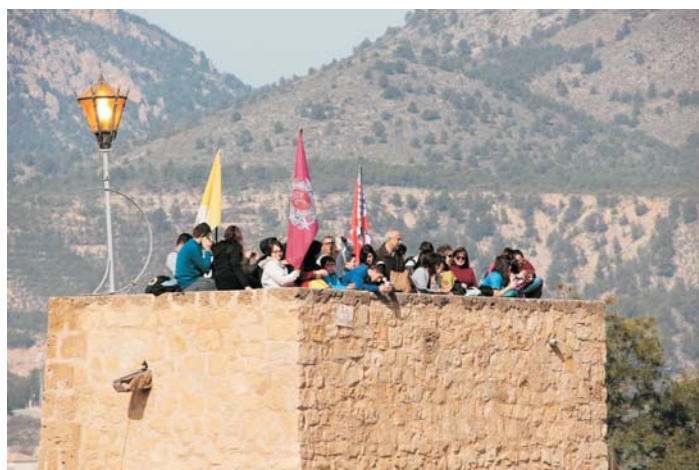
De día y de noche la "luz jubilar" permanece encendida

Desde la apertura del Año Jubilar, el pasado 8 de enero, y hasta su clausura, el 7 de enero del próximo año, esta luz jubilar permanecerá encendida las 24 horas de cada día, como faro que guía los pasos hasta la Vera Cruz.