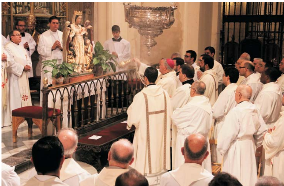
El Jubileo finalizó rezando el Magnificat ante la Virgen de la Merced

Revista digital de la Diócesis de Cartagena