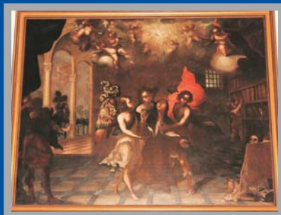
Éxtasis de Santa Teresa, s.XVIII MM. Agustinas Descalzas. Murcia