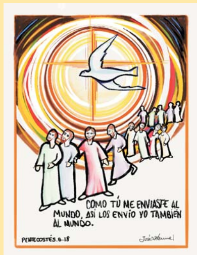
DIBUJO: Mons. Lorca Planes