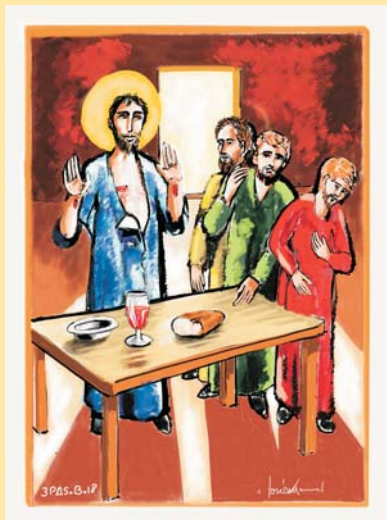
DIBUJO: Mons. Lorca Planes