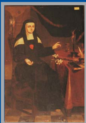
Santa Clara de Montefalco Anónimo, s. XVIII Monasterio del Corpus Christi Agustinas Descalzas, Murcia

En el Monasterio del Corpus Christi se conservan dos imágenes de Santa Clara de Montefalco: una en el retablo mayor y este lienzo en el coro bajo conventual. Los atributos permiten una clara identificación: su corazón en el que aparecieron, tras su muerte, impresas las armas de la pasión de Cristo, y las tres piedras del mismo tamaño que aparecieron en su vesícula, pesando cada una de ellas lo mismo que las tres juntas. La singularidad del lienzo está en aparecer la santa vestida con el hábito de agustina descalza y no con el de agustina, orden a la que pertenecía. Su beatificación en la primera mitad del siglo XVIII llevaría al convento murciano de Agustinas Descalzas a desear incluir una imagen suya entre sus obras y a hacerla más propia vistiéndola como ellas vestían, siendo incluso posible que se trate de un "retrato a lo sagrado", retrato de alguna religiosa que viviera en la comunidad representada al modo de Santa Clara de Montefalco, costumbre habitual durante los siglos del Barroco.