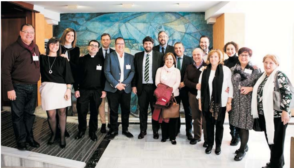
López Miras y algunos diputados populares con la representación de la Hospitalidad

Una delegación caravaqueña, encabezada por el Obispo y la hermana mayor de la Cofradía de la Vera Cruz, participó el miércoles en la Audiencia General para hacerle entrega al Santo Padre del óbolo del Año Jubilar de Caravaca, para que lo destine a obras de caridad. (Pág. 8)