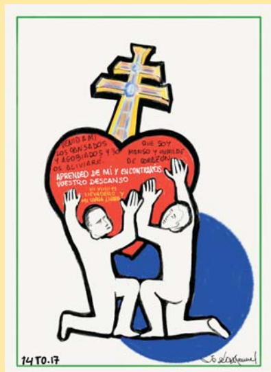
DIBUJO: Mons. Lorca Planes

«Venid a mí todos los que estáis cansados y agobiados, y yo os aliviaré»