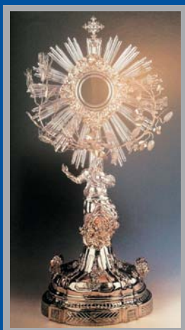
Custodia Carlos Zaradatti, 1796. Parroquia de la Purísima, Fortuna.

Una bellísima pieza de orfebrería eucarística de la Diócesis de Cartagena es la custodia de la iglesia parroquial de la Purísima Concepción de Fortuna. Obra de Carlos Zaradatti, presenta como característica más singular la inclusión de la imagen de la fe en sustitución del astil, subrayando de ese modo los valores escultóricos del diseño. El viril queda orlado por una nube con cabezas de ángeles arremolinadas y por una guirnalda de espigas y racimos de uva dispuestos sobre las ráfagas de plata, evidenciando que aunque veamos pan, pues permanecen los accidentes, lo que allí se manifiesta no es sino el Cuerpo, la Sangre, el Alma y la Divinidad de Nuestro Señor Jesucristo, a quien adoran los ángeles. La fe, que aparece como exultante mujer con los ojos velados, viene a recordarnos la presencia verdadera, real y sustancial de Cristo, no una presencia simbólica ni virtual. Esa es la fe de la Iglesia que movió la devoción de los vecinos de Fortuna en 1796, como reza la inscripción de la base de la custodia, a ofrendar esta bellísima obra a su parroquia de la Purísima Concepción, cuya imagen se inserta a modo de distintivo de pertenencia.