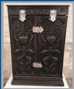
Caja de la corona de la Coronación Canónica, 1927 Museo de la Catedral de Murcia.