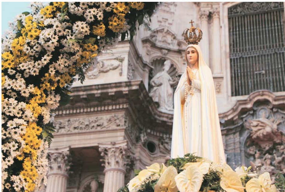
La imagen durante la Eucaristía celebrada en la Plaza del Cardenal Belluga

Revista digital de la Diócesis de Cartagena