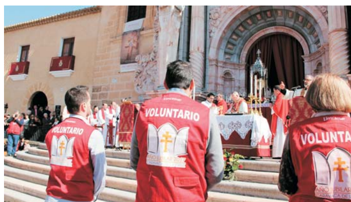
Los voluntarios, durante la Misa Jubilar en la explanada