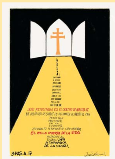
DIBUJO: Mons. Lorca Planes

Y ellos contaron lo que les había pasado por el camino y cómo lo habían reconocido al partir el pan.