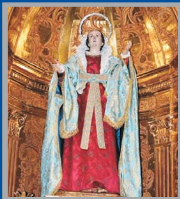
Dolorosa. Francisco Salzillo. s. XVIII Parroquia de San Miguel. Murcia