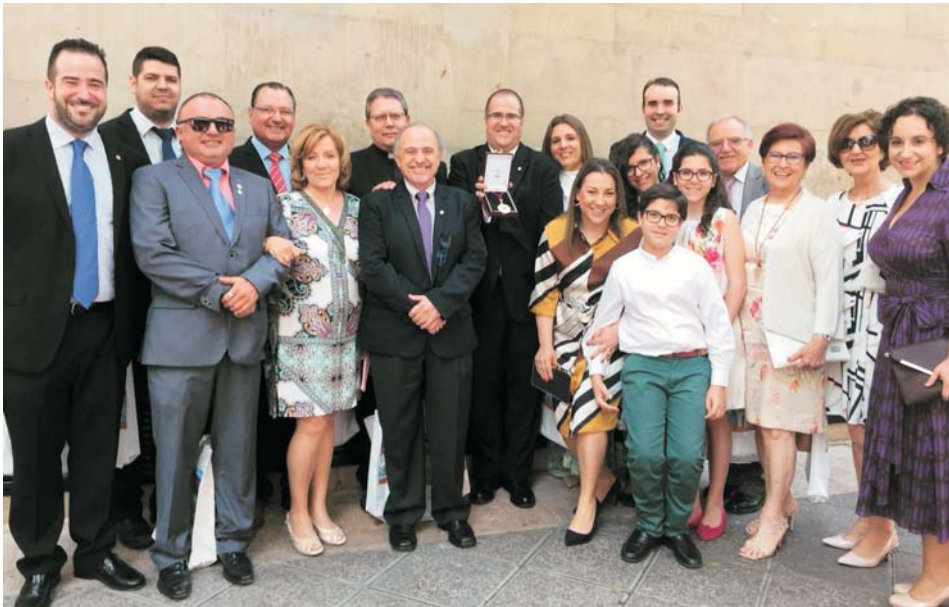
El presidente y la junta directiva de la Hospitalidad, tras recoger la Medalla de Oro

Revista digital de la Diócesis de Cartagena